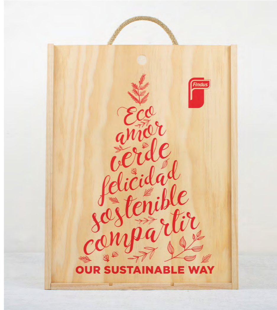
SERIGRAFÍA EN LA TAPA DE LA CAJA