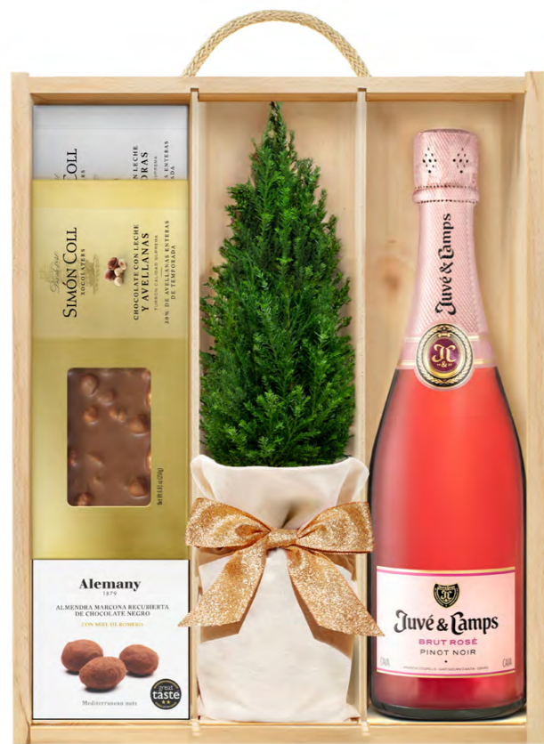
GO401N LOTE GOURMET COLOR DE NAVIDAD