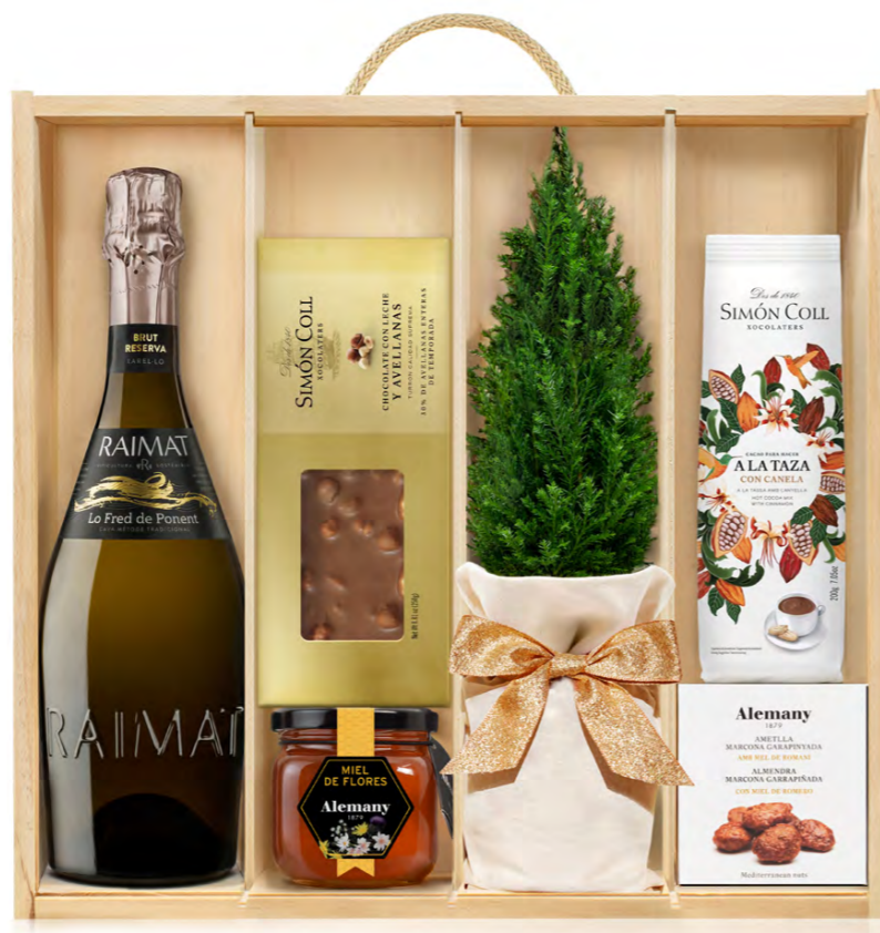
GO404N LOTE GOURMET NOCHE INVERNAL CON CAVA