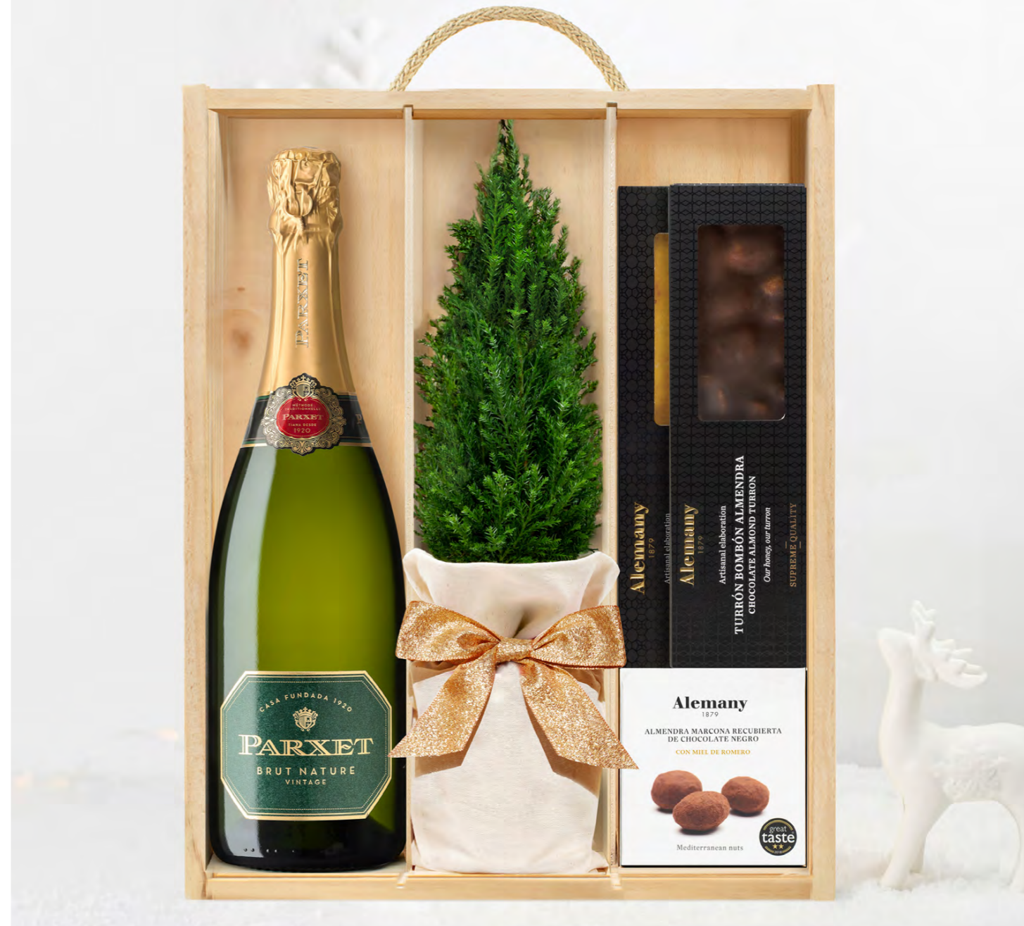
GO290N LOTE GOURMET NAVIDAD SPARKLING