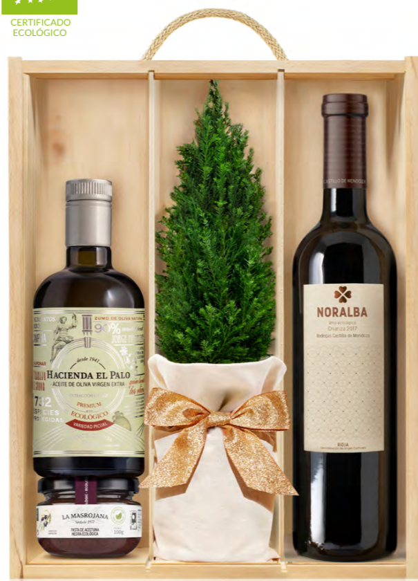
GO326N LOTE GOURMET NAVIDAD ECO VINON