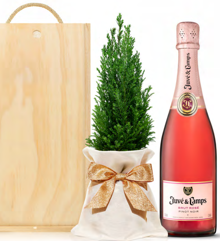
GO396N SET NAVIDAD BODEGA ROSÉ

Cava Juvé & Camps Brut Rosé Pinot Noir . 75 cl.