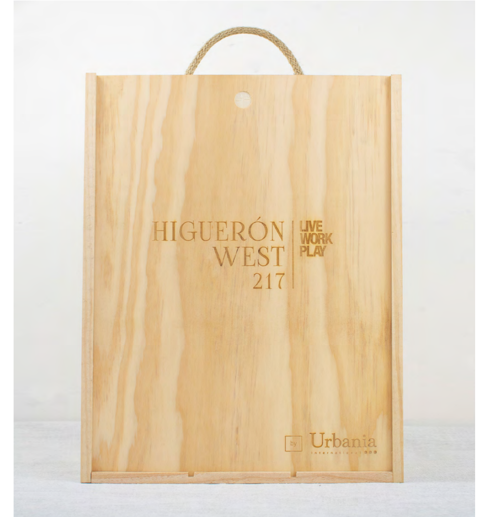
GRABADO LÁSER EN LA TAPA DE LA CAJA