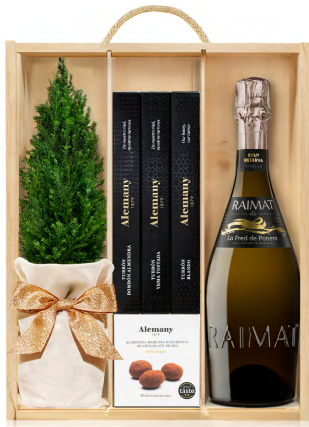
GO289N LOTE GOURMET JINGLE BELLS