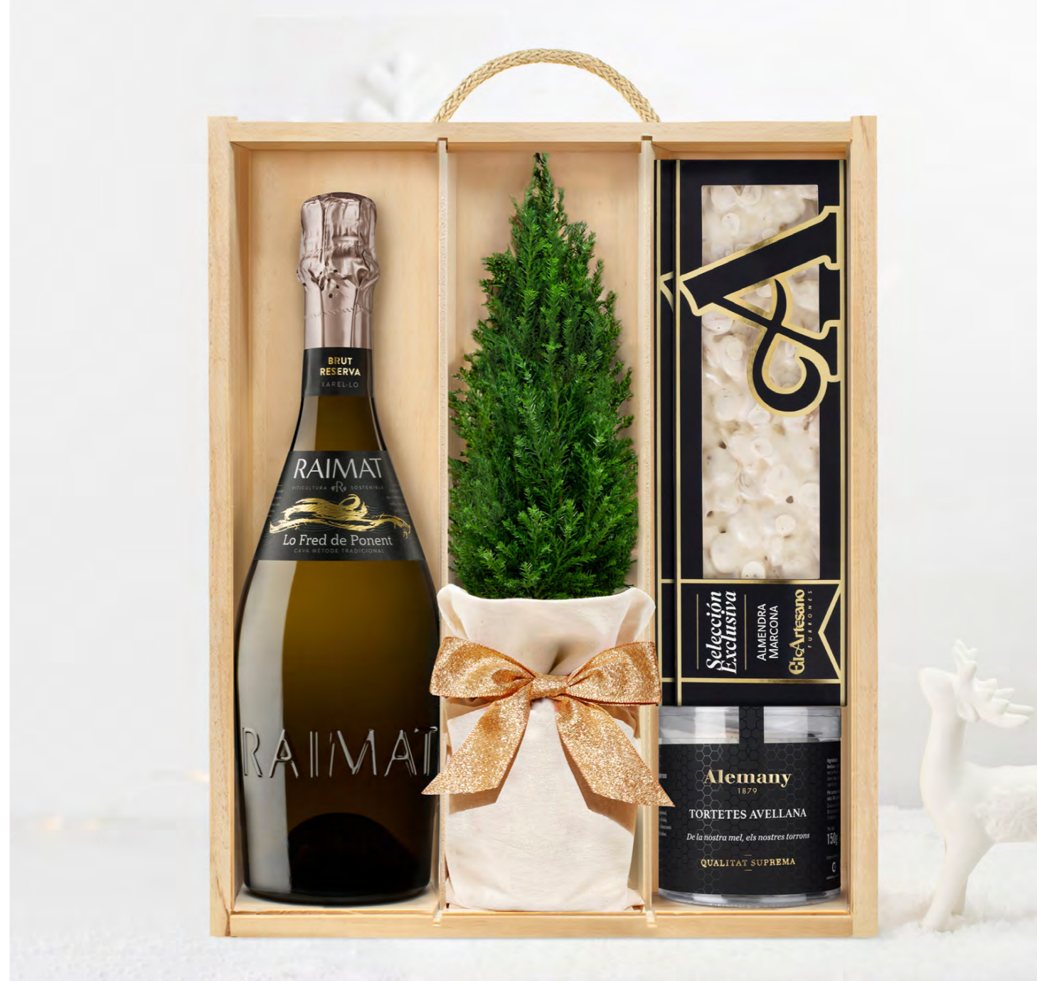
GO372N LOTE GOURMET DECEMBER