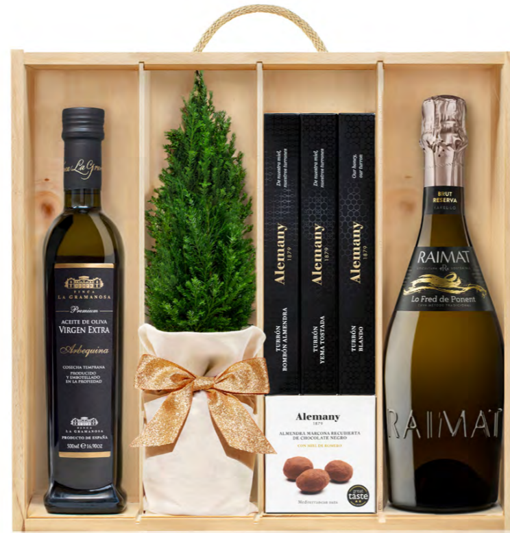
GO358N LOTE GOURMET NAVIDAD DELICATA LO FRED