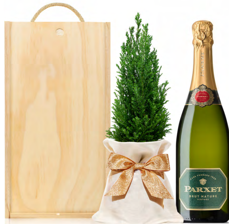
GO264N SET CAVA BRUT RESERVA PARXET

- Cava Parxet Brut Nature Reserva ecológico. 75 cl.