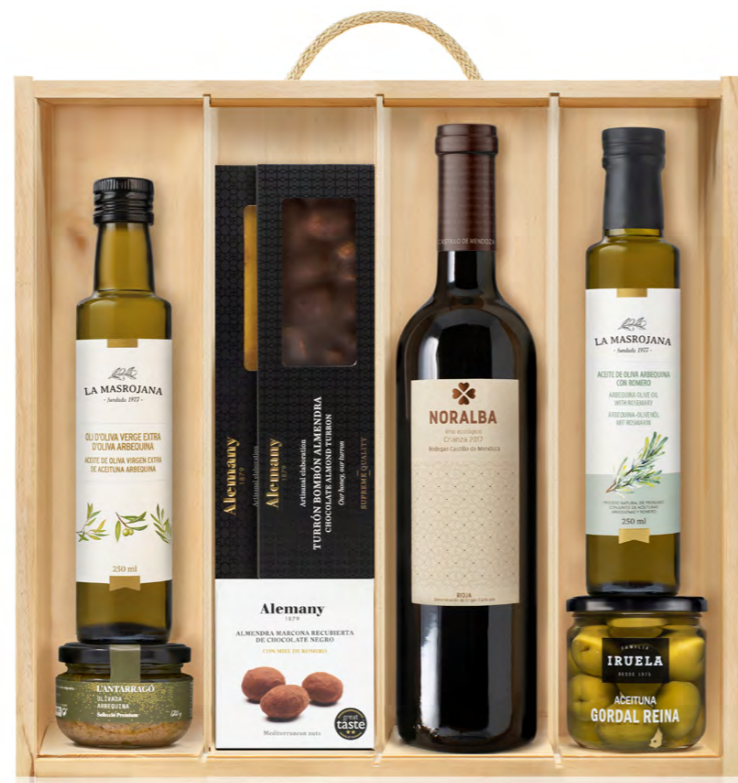
GO363B LOTE GOURMET NAVIDAD ARTEMISA