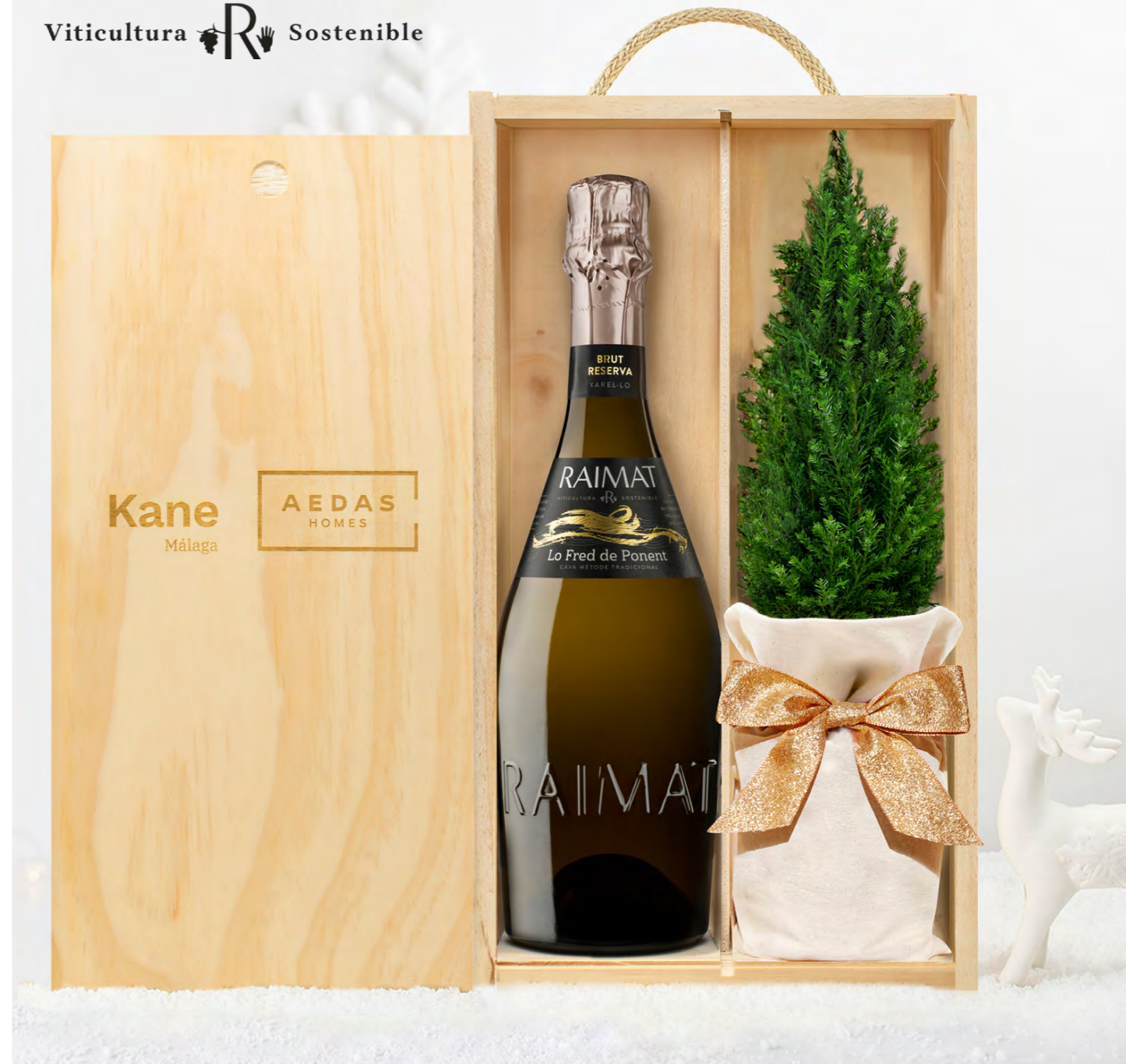
GO265N SET CAVA BRUT RESERVA LO FRED DE PONENT

- Cava Brut Reserva Lo Fred de Ponent 75 cl. (Viticultura Sostenible)