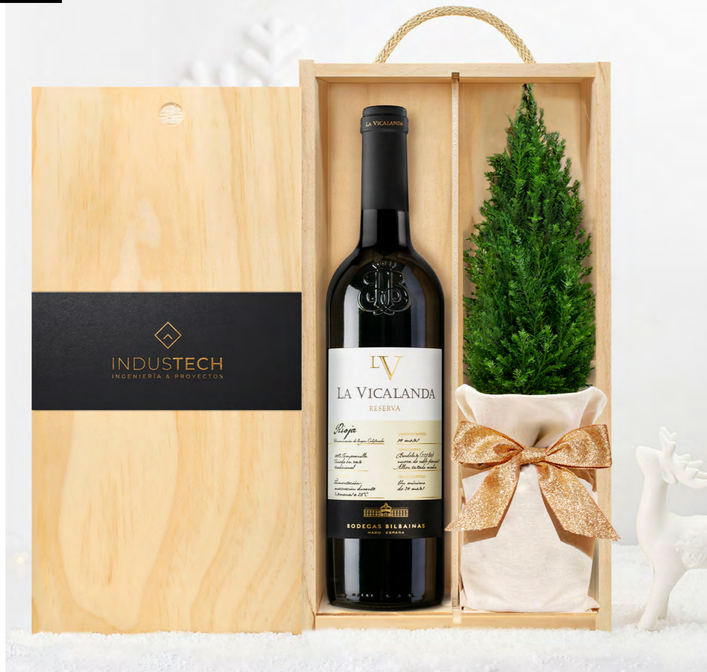
GO233N SET BODEGA NAVIDAD VICALANDA RESERVA