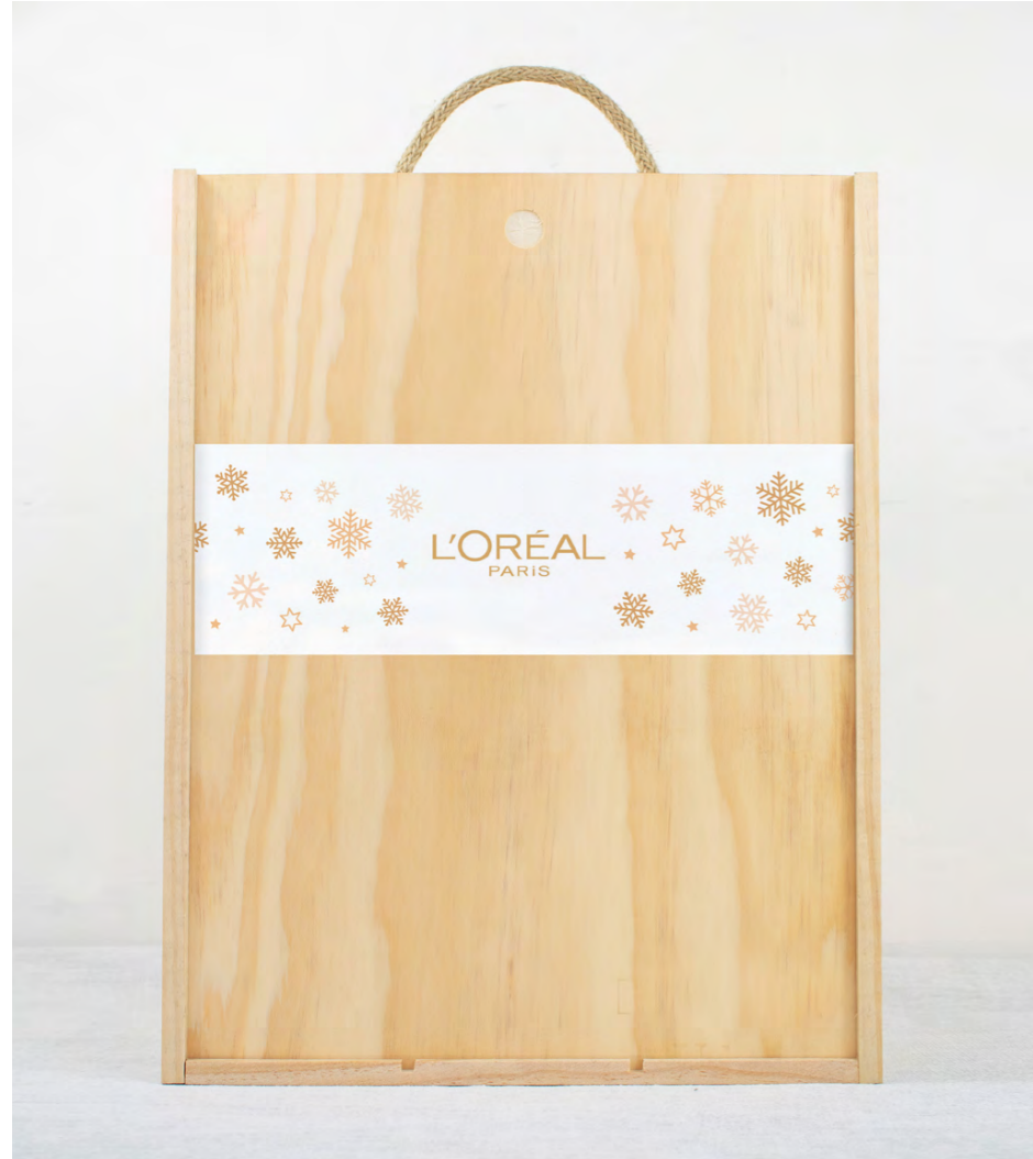
TARJETÓN EN LA TAPA DE LA CAJA