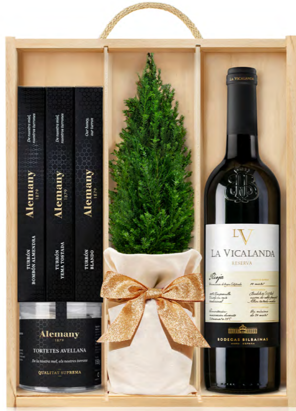
GO369N LOTE GOURMET NAVIDAD SUPREME