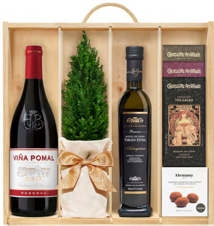
GO341N LOTE GOURMET NAVIDAD DETAILS