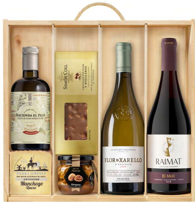
GO407B LOTE GOURMET CASEUS NAVIDAD ENOLOGY