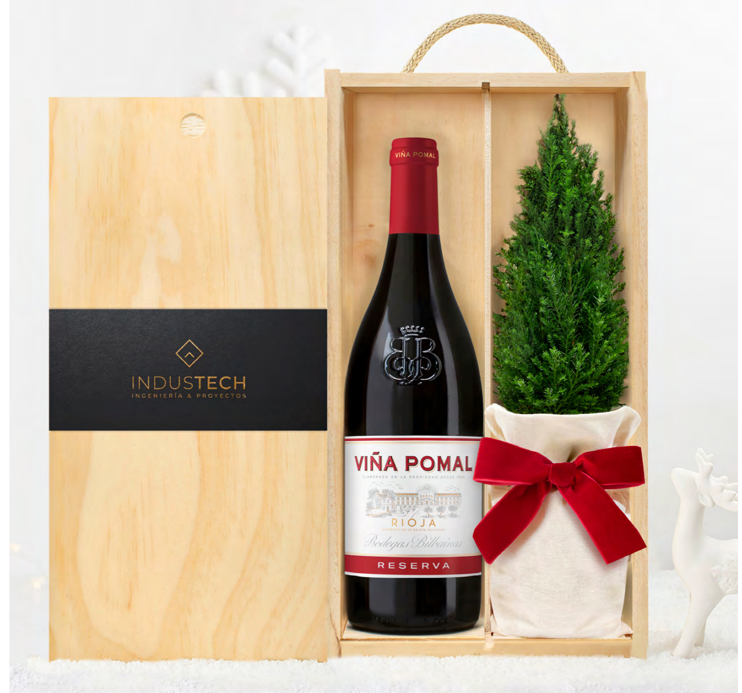
GO313N SET BODEGA CENTENARIO RESERVA