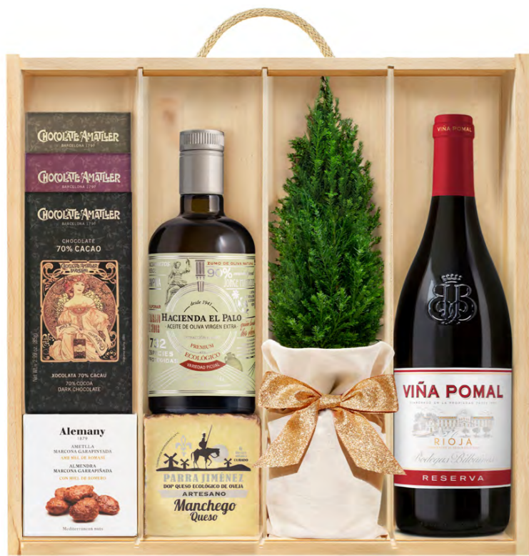
GO392N LOTE GOURMET NAVIDAD PRIMORA