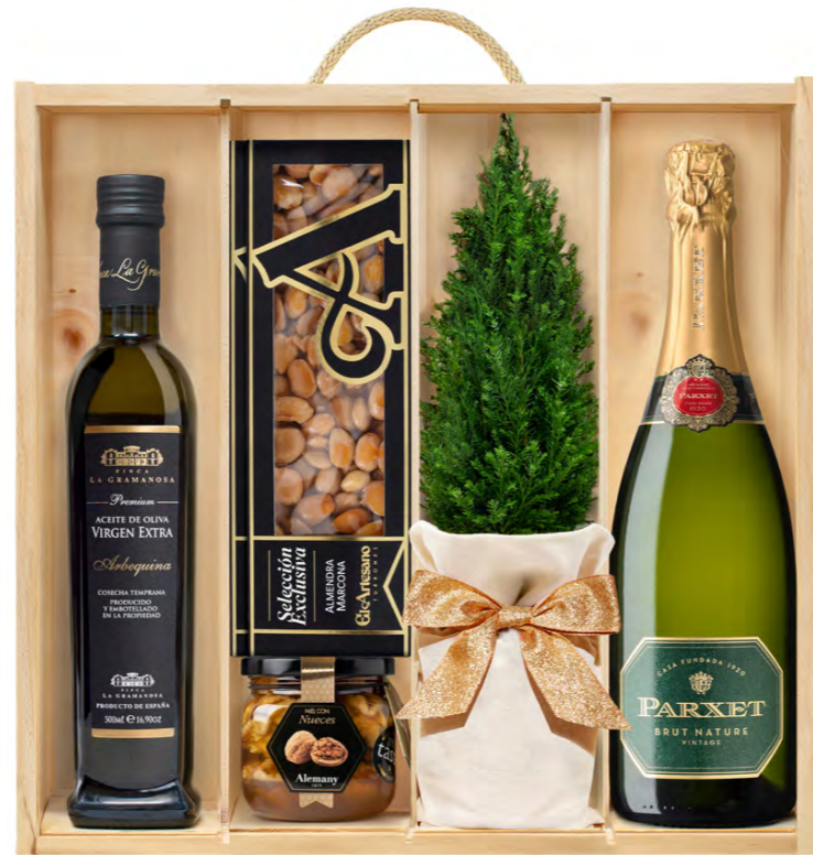
GO365N LOTE GOURMET NUTS RESERVA