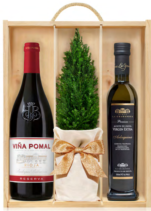
GO235N LOTE GOURMET DELECTA NAVIDAD RESERVA