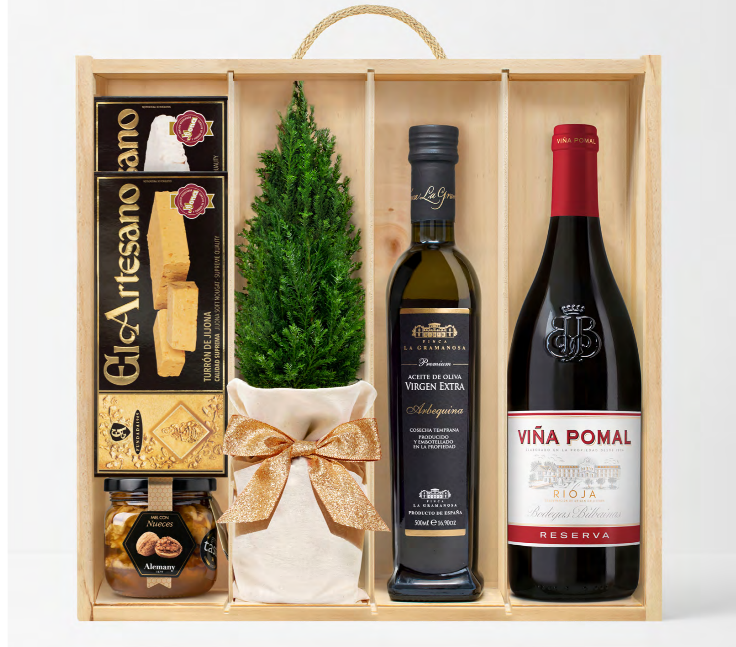
GO364N LOTE GOURMET NATALIS VIÑA