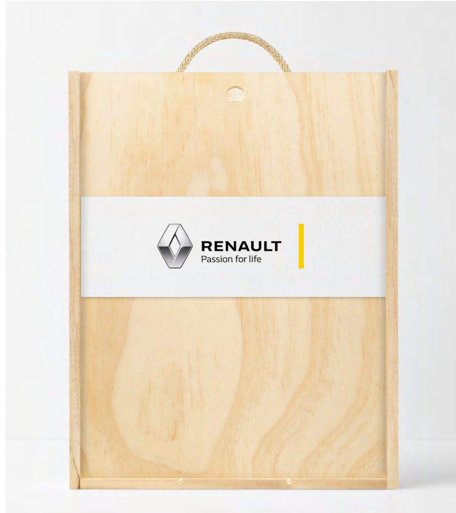
TARJETÓN EN LA TAPA DE LA CAJA