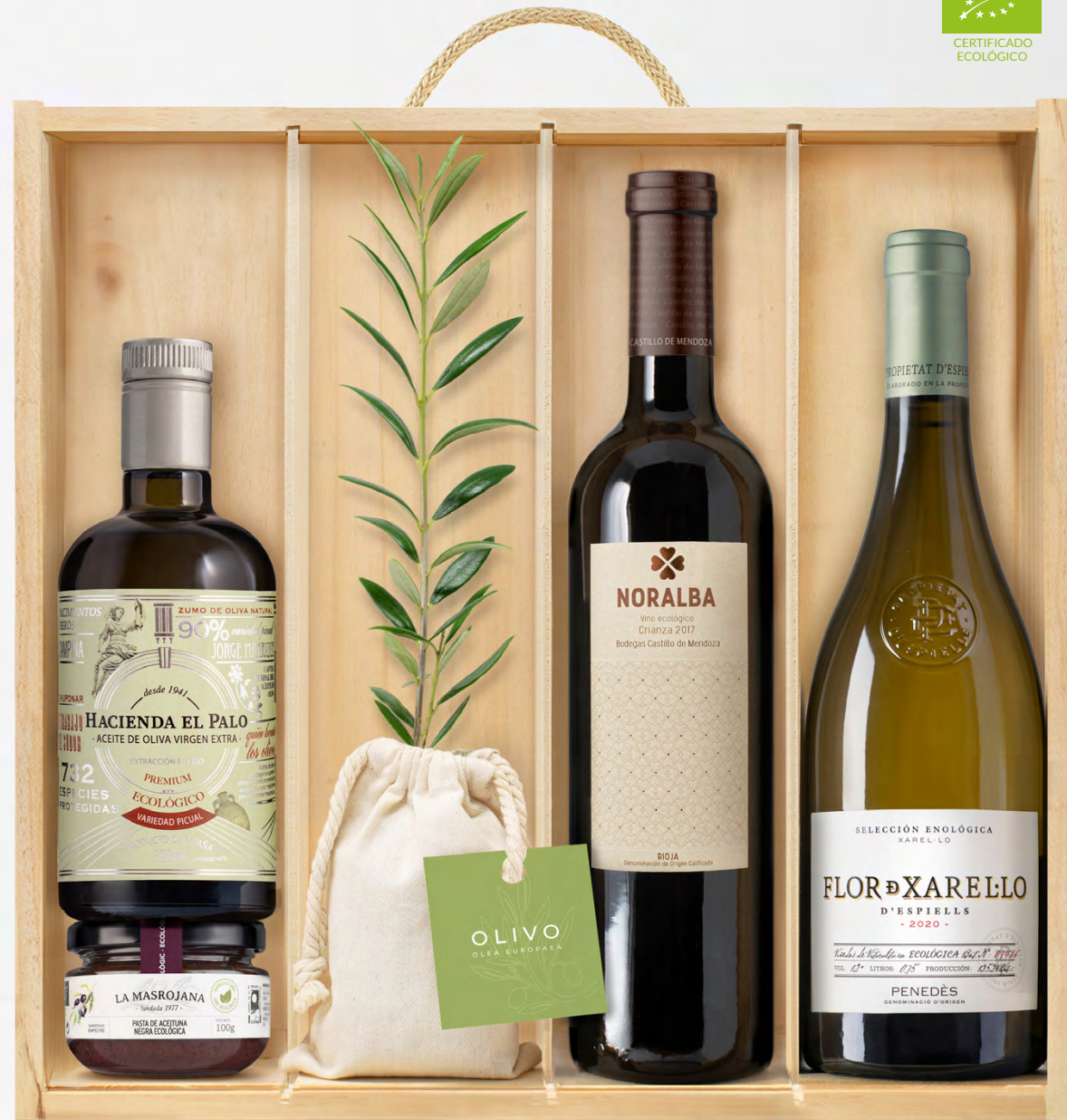
GO329 LOTE GOURMET ECO CELLAR