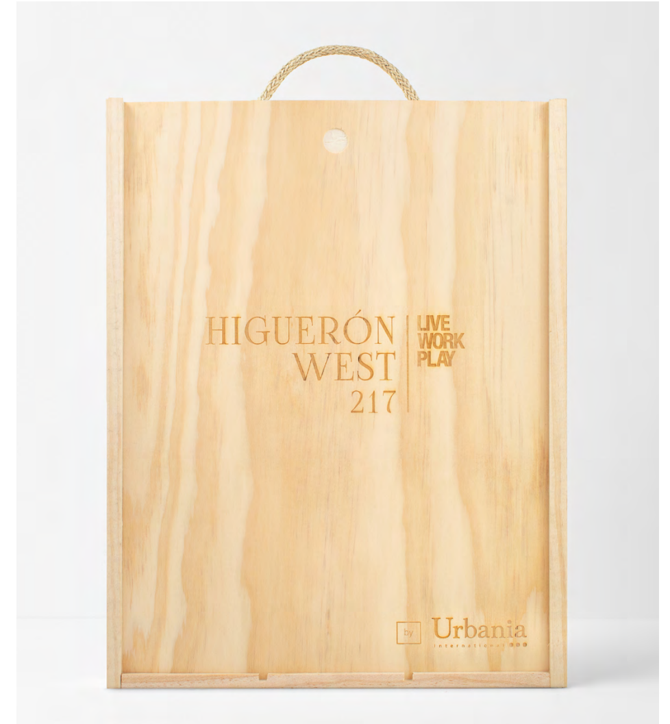
GRABADO LÁSER EN LA TAPA DE LA CAJA

Coste fotolito + pantalla: 49€ por color