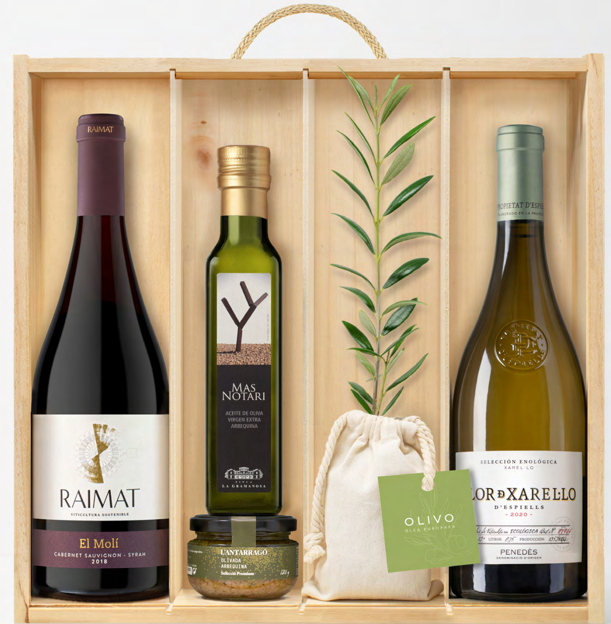
GO131 LOTE GOURMET ELEGANCE