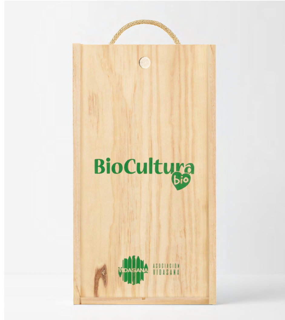
SERIGRAFÍA EN LA TAPA DE LA CAJA