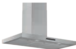
DWB96DM50 Decorativa Pared 90 cm | Serie 4