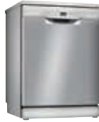
SMS2HTI60E Lavavajillas Silence 12 C Inox 60cm | Serie 2