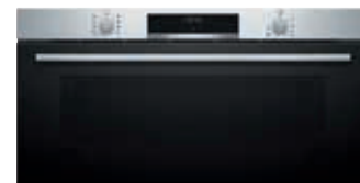
HSG636BS1 Horno 60 cm. 4D Hotair Vapor | Serie 8