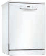
SMS2ITW04E Lavavajillas AquaStop 12 C Blanco 60cm | Serie 2