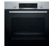
HBG634BB1 Horno 60 cm 4D Hotair | Serie 8