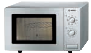
HMT72G450 Serie | 2 Acero inoxidable