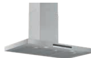
DWB97IM50 Decorativa Pared 90 cm | Serie 4