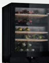
KWK16ABGA Cava de vino | Serie 6