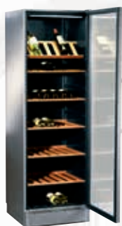
KSW38940 Cava de Vino XXL | Serie 8