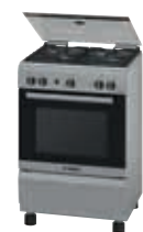
HSG14I21SE Cocina PRO425 | Serie 2