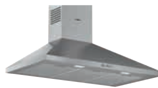
DWP94BC50 Piramidal 90 cm | Serie 2