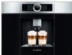
CTL636ES1 Cafetera Espresso Gourmet | Serie 8