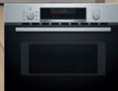
CMA583MS0 Serie | 4 Horno con microondas y grill