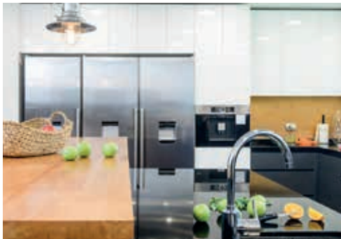
Cocina | Pitreño