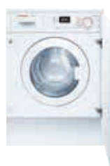
WTG86263CL Secadora 7 kg Condensación blanca | Serie 6