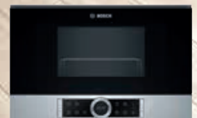
BEL634GS1 Microondas con Grill | Serie 8