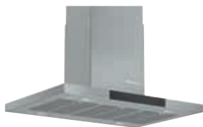
DIB98JQ50 Decorativa Isla 90 cm | Serie 6