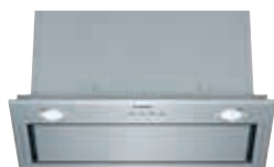
DHL585B Integrable 52 cm | Serie 6