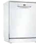
SMS2HTW60E Lavavajillas Silence 12 Blanco 60cm | Serie 2