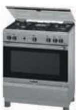
HSK14I24SE Cocina PRO525 | Serie 2