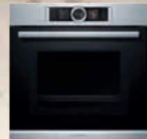
HNG6764S1 Horno c/microondas 60 cm. Vapor - Pirólisis | Serie 8

Termosonda para una cocción desde el interior Para una cocción perfecta, es importante conseguir excelentes resultados de rostizado y asado en el exterior del alimento, pero sobre todo en su interior. La termosonda permite asegurar el punto óptimo de cocción. Se conecta en el horno, se introduce en el alimento y sus sensores miden en todo momento la temperatura real en el interior del alimento. Permite programar una cocción, asegurando la textura y el resultado. Cuando la termosonda detecta la temperatura prefijada en el centro del alimento, el asado ya está listo, avisa y desconecta automáticamente la cocción.