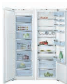
588 lts. max.

Combinando un refrigerador y congelador de una puerta se obtiene una mayor capacidad para conservar y almacenar alimentos. Es importante instalarlos con el accesorio de unión. Capacidad máxima de 588 litros.