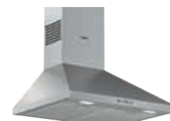
DWP64BC50 Piramidal 60 cm | Serie 2