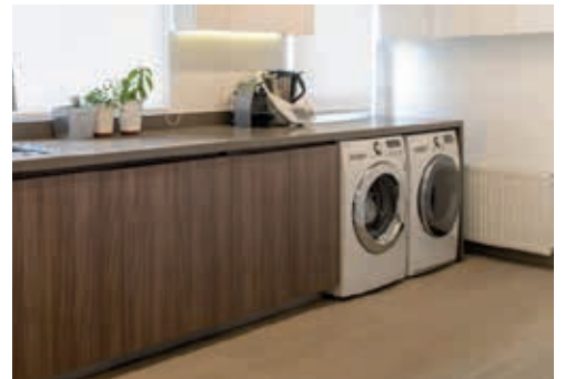
Cocina | Luis Carrera