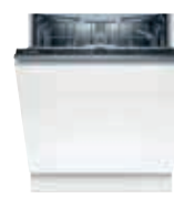
SMV2HVX20E Lavavajillas Panelable Silence 13 C 60cm | Serie 2