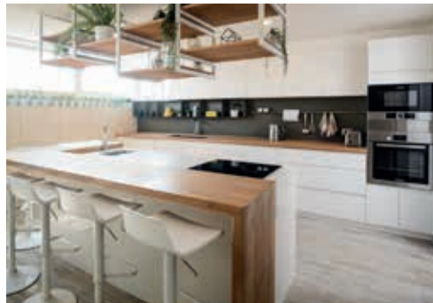
Cocina | HieloSur