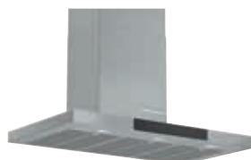
DWB98JQ50 Decorativa Pared 90 cm | Serie 6