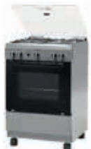
HSG18C20SE Cocina PRO423 | Serie 2