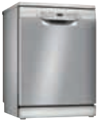
SMS2TI04E Lavavajillas AquaStop 12 C Inox 60cm | Serie 2