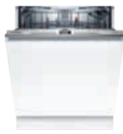
SMV6ZCX07E Lavavajillas Panelable PerfectDry Zeolitas 14 C 60cm | Serie 6