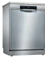
SMS68TI03E Lavavajillas 14C PerfectDry Inox | Serie 6