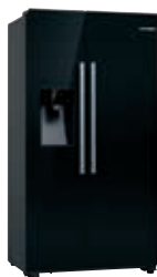
KAD93VBFP Refrigerador Side by Side negro | Serie 6