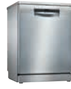
SMS4HVI33E Lavavajillas SilencePlus 13 C Inox 60cm | Serie 4