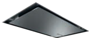
DRC97AQ50 Extrator de techo 90 cm | Serie 6