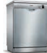
SMS25AI05E Lavavajillas AquaStop 12 C Blanco 60cm | Serie 2