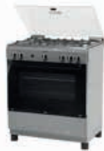
HSK18C20SE Cocina PRO523 | Serie 2