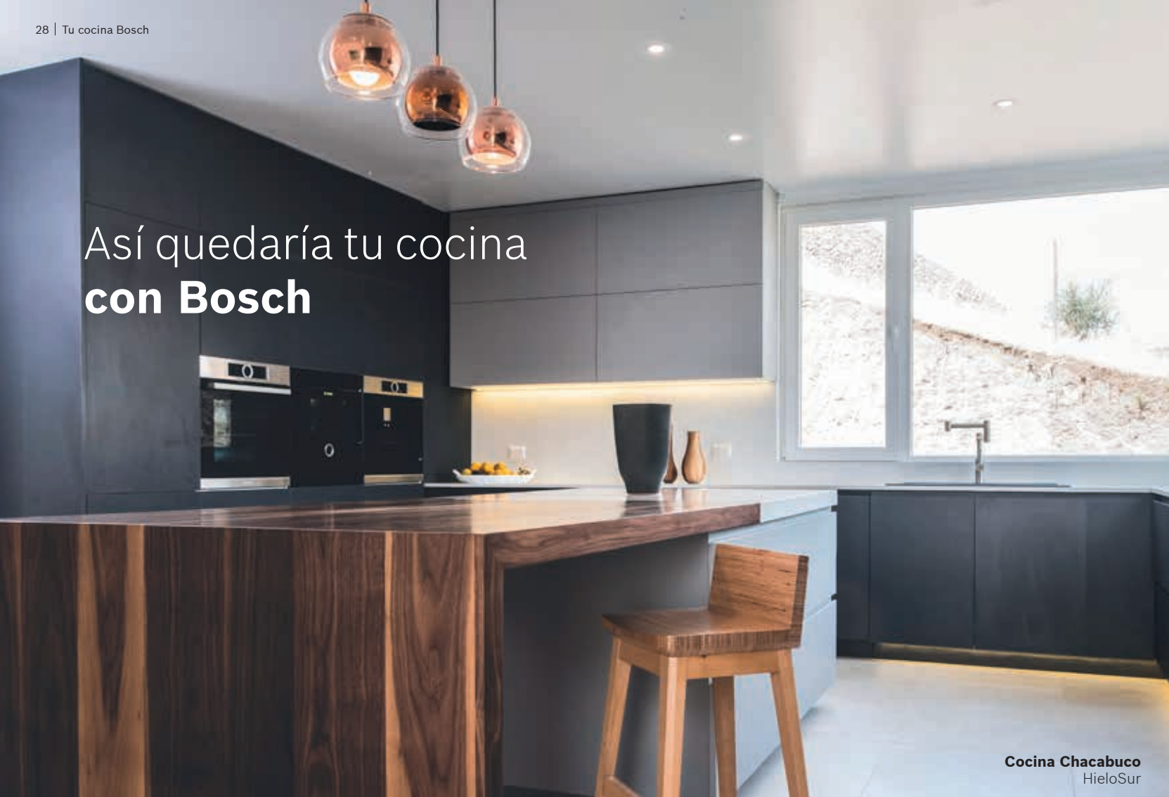
Cocina Chacabuco HieloSur