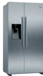
KAD93VIFP Refrigerador Side by Side Inox | Serie 6