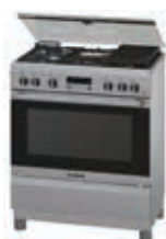
HSK12I26SE Cocina PRO549 | Serie 4