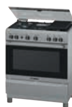
HSK44I25SE Cocina PRO547 | Serie 4