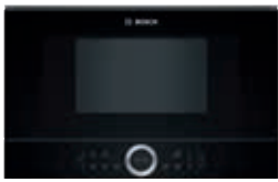
BFL634GB1 Serie | 8 Cristal negro