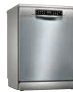
SMS6ECI63E Lavavajillas SilencePro 14 C Inox 60cm | Serie 6