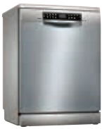
SMS6ZCI42E Lavavajillas PerfectDry Zeolitas 14 C Inox 60cm | Serie 6