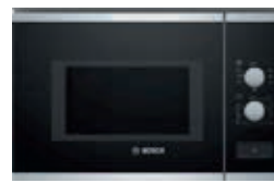
BEL550MS0 Serie | 4 Cristal negro con grill