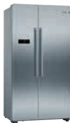
KAN93VIFP Refrigerador Side by Side | Serie 4