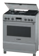
HSK75I44SE Cocina PRO567 | Serie 6