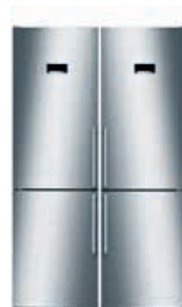
Hasta 1010 lts.

Es posible la unión de dos combis juntos para conseguir hasta un total de 1010 litros.