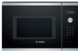
BEL554MS0 Serie | 6 Cristal negro y acero