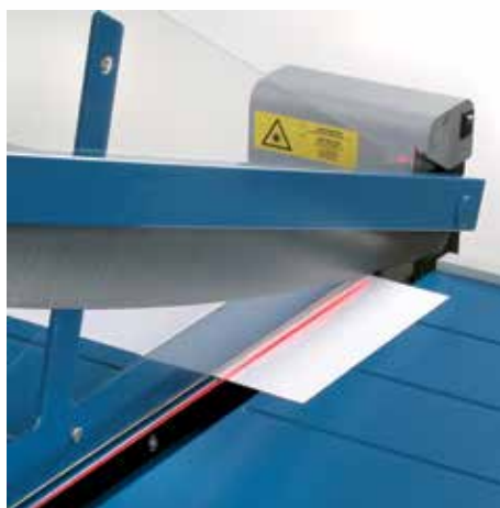
Indicación precisa del corte por láser opcional para resultados de corte profesionales