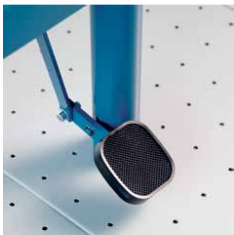
Confortable pedal de prensado para un prensado seguro de grandes formatos