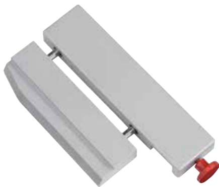
Dispositivo de tiras estrechas para cortar tiras extremadamente finas, opción