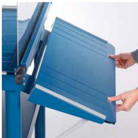
Mesa delantera plegable para cortes de grandes formatos