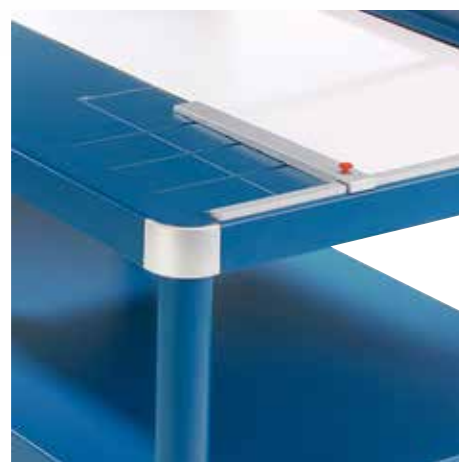
Tope posterior regulable de metal para la detección rápida del formato, aplicable en ambos topes angulares y en la mesa delantera